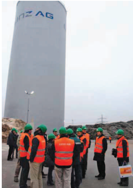
El viaje incluyó visitas a fábricas, plantas energéticas y centros tecnológicos

La delegación estuvo formada por una veintena de empresas y cerca de diez entidades e instituciones, todas ellas miembros del Cluster de Energías Renovables y Eficiencia Energética de Donostialdea. Además de Fomento, participaron en la misión empresas relevantes del sector, centros tecnológicos como Tecnalia y otras entidades como la Diputación Foral de Gipuzkoa, el Ayuntamiento de Donostia-San Sebastián, el EVE, Kutxa, Zubigune Fundazioa y el Instituto de Usurbil de Energías Renovables. Todos los participantes en este viaje empresarial